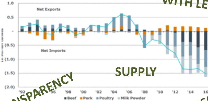
ina Net Trade in Animal Protein – Beef, Pork, Poultry & Milk powder

AGRICULTURE - AN EARLY STAGE INVESTMENT CLASS