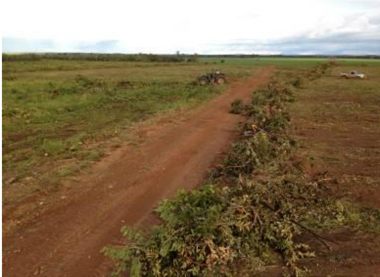
Markerne skal først ryddes for trævækst – i baggrunden en dyrket mark

Vi regner med at gå i gang med at høste om et par uger. Den første mark er allerede ret gul, og når alle blade er visnet og stænglerne tørre, er det høsttid for sojabønner. Vi har solgt en del af den kommende høst for at sikre prisen. I år lejer vi os til mejetærsker.