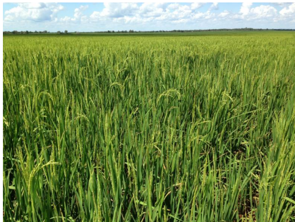
Rismark i blomst hos AgroBrazil