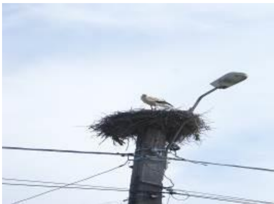
Storken er kommet til Rumænien