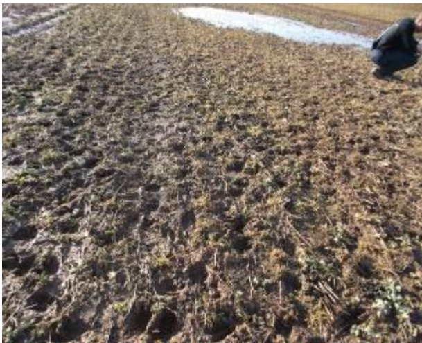
Forår i Letland